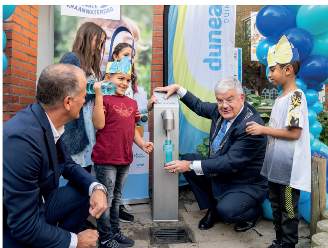
Officiële opening van een tapkraan bij basisschool 't Palet in Den Haag

Gaat uw gemeente, uw school of uw sportvereniging een duurzame samenwerking aan met Dunea, dan worden de volgende afspraken contractueel vastgelegd.